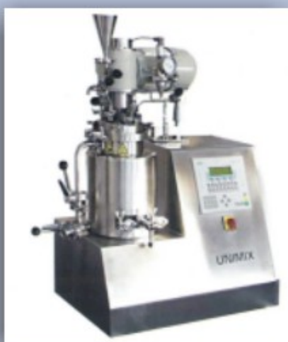
UNIMIX LM 3