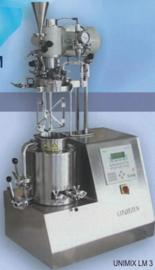
UNIMIX LM 3

The UNIMIX Laboratory Mixer Type LM allows simulation of production conditions to establish data for scale-up to production units.